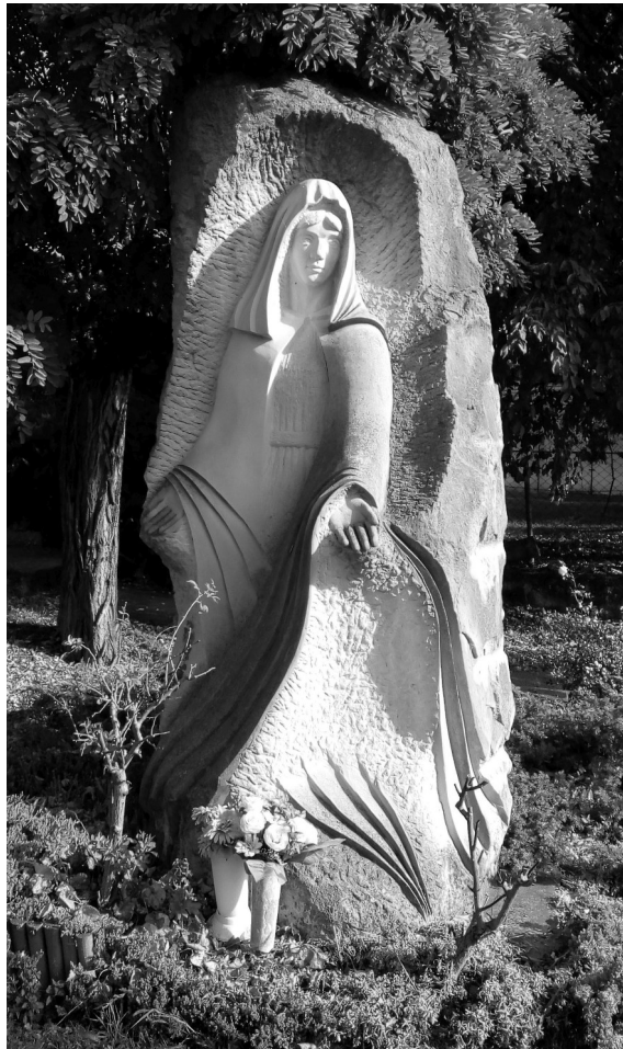
Pólin Elek: Mária – (fotó Kómár Katalin) A szobor Kozárdon a Mária-út egyik állomása

„Sose kételkedjünk abban, hogy gondolkodó, elkötelezett emberek kicsiny csoportjai meg tudják változtatni a világot. Valójában csak ők tudják megváltoztatni.” (Margaret Head)