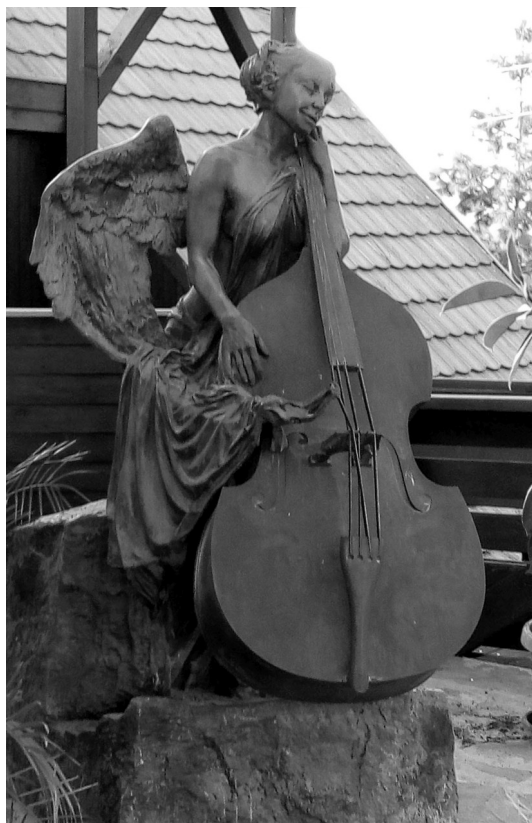
Párkányi Raab Péter: Zenélő Angyal