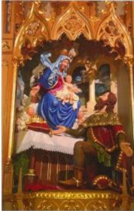
Szent István felajánlja koronáját és országunkat Szűz Máriának – a Lipnica Mala-i templom oltárának fafaragása (A fotóért köszönet a szobrot faragó Marian Smreczak úrnak)

Ezúton szeretném megköszönni a lista összeállítójának értékes és hiánypótló munkáját, de a lista egy kis kiegészítésre szorul. Lengyelországban is vannak Szent István király tiszteletére szentelt templomok, összesen 4.